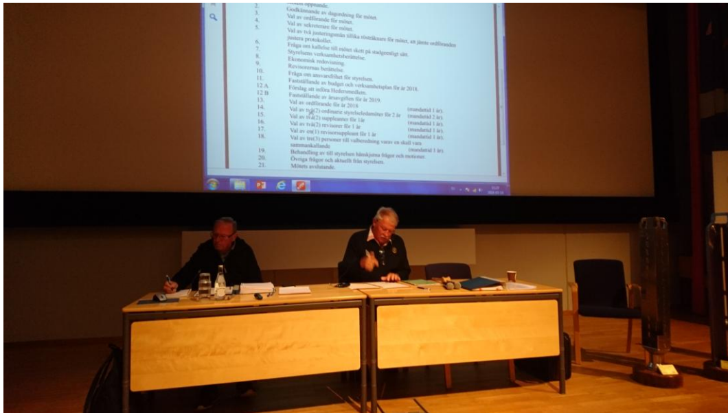
9. Mötesförhandlingarna startar.