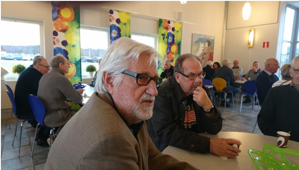
1. Kaffe innan mötet börjar.....